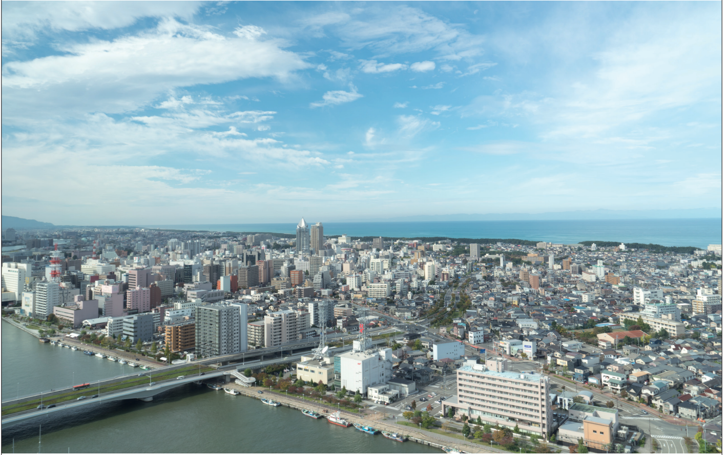
万代島ビル展望台から信濃川と古町方面の景色 (ツバコー北陸販売株式会社設立の地)

IRページはこちら https://www.tsubaki.co.jp/ja/ir/