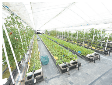
ビニールハウス内の広々とした開放感のある環境