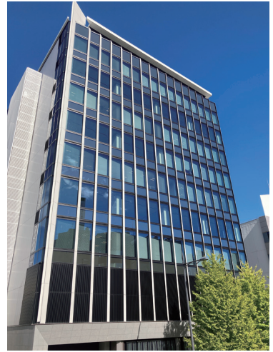
ツバコー北陸販売株式会社

【本社】〒950-0087 新潟県新潟市中央区東大通2丁目4番10号 (日本生命新潟ビル七階) TEL.025-282-5510 FAX.025-282-5740