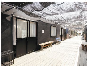
救護室、休憩室、更衣室完備

土ではなく軽石を使用しており、労災面で安心・安全となっています。土とは異なり、汚れなどがつかず、清潔な環境で作業ができるようになっています。